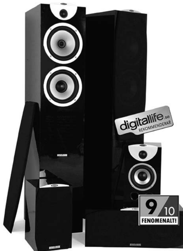
Dynavoice Magic F-6 EX