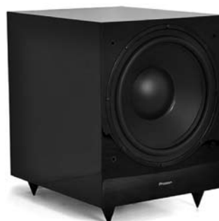
Proson Rumble R-12