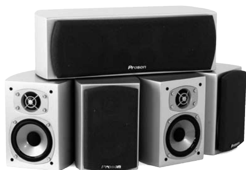
Proson Reality Sat 31 (v.2)

PROSON Väri/pituus EAN-koodi Suos. ALV 23 %