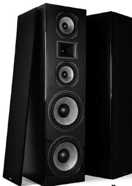
Proson Stadium 10 (v.2)