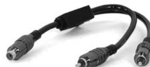
Proson RCA Y -kaapeli