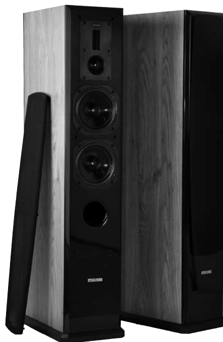
Dynavoice Definition DF-5