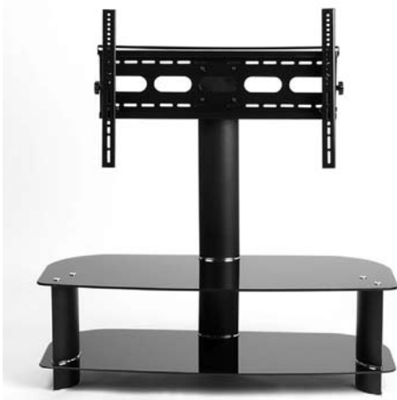
Senaco SN 2114